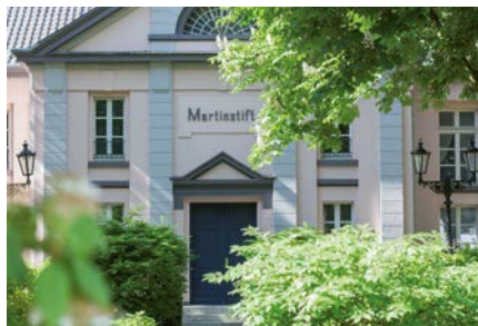
Kammermusiksaal im Martinstift Moerser Musikschule Filder Straße 126 • 47447 Moers