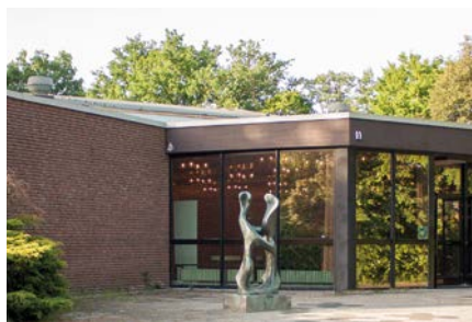
Kulturzentrum Rheinkamp Kopernikusstraße 11 • 47445 Moers